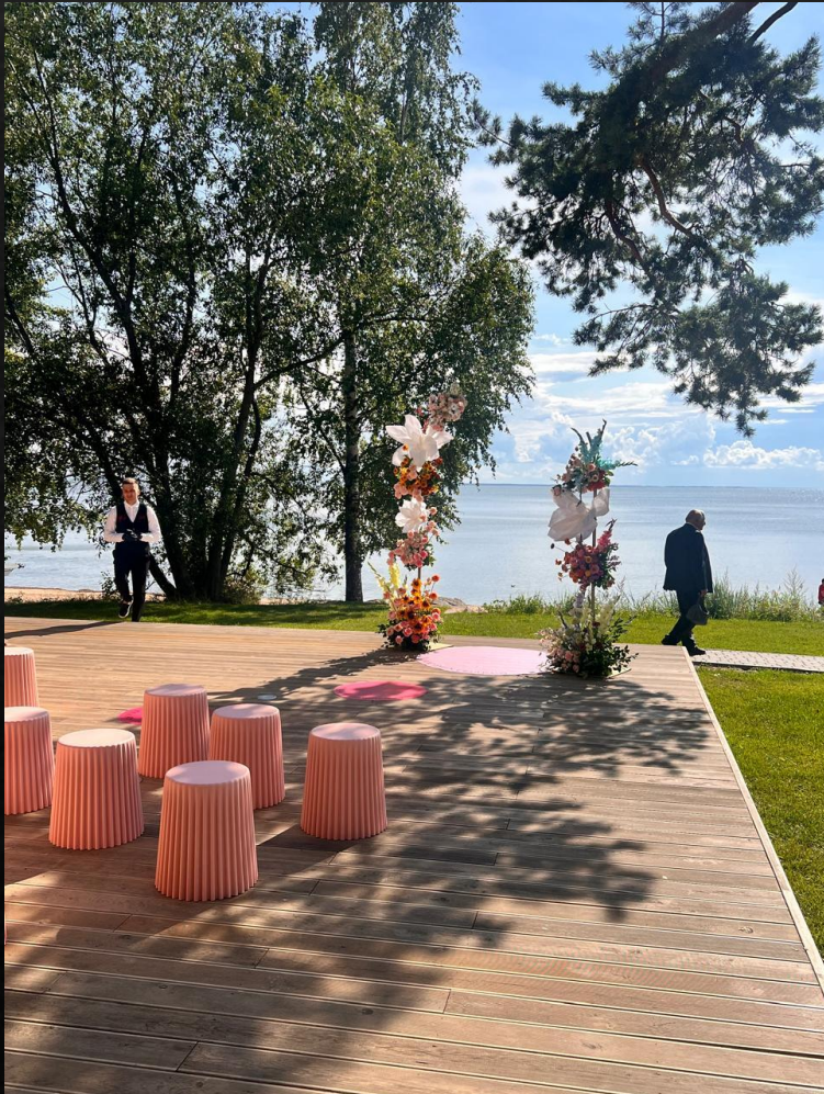
Фото с проведенных мероприятий